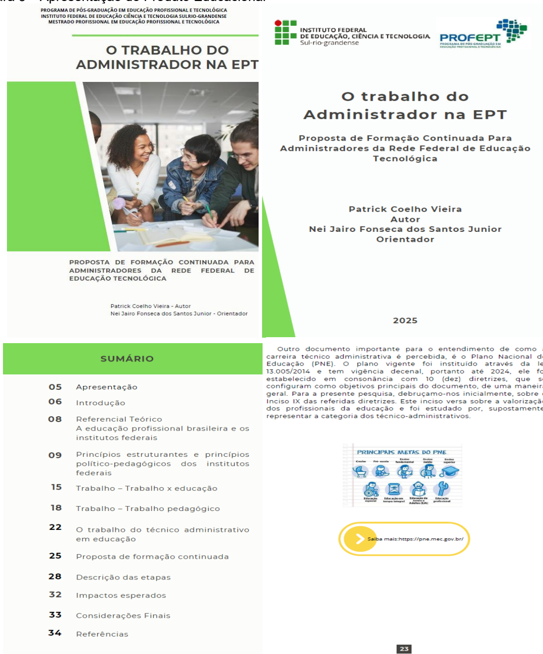
Figura 3 – Apresentação do Produto Educacional

A Figura 3 traz a apresentação do Produto Educacional.