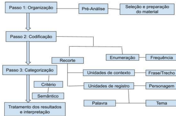
Figura 2 – Desenvolvimento da análise (Inspirado na teoria de Laurence Bardin)

Fonte: Elaborado pelos autores. Adaptado de Bardin (2011).